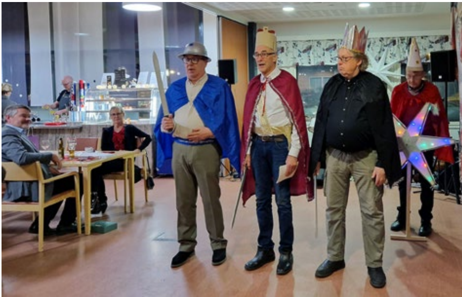
Haukiputaan eläkeläisten tuore versio tiernapojista oli mainio.

Pikkujoulua vietettiin 7.12.2024 Haukiputaalla, Lounas-Kahvila Nymannissa. Tässä tilassa olimme myös vuotta aiemmin, jolloin totesimme, että tila oli oikein sopiva pikkujoulun pitopaikaksi. Paikalla oli noin 75 yhdistyksemme jäsentä tai heidän perheenjäsentensä.