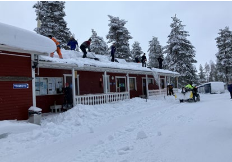
Tuvan katon lumen pudotustalkoot.